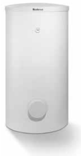
Logalux SH RW

со встроенным теплообменником большой поверхности нагрева – повышенный комфорт в обеспечении горячей водой в сочетании с тепловыми насосами Logatherm WPS/WPS K от 6 до 60 кВт. Этот вариант подходит и для применения в двухквартирных жилых домах.