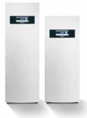
Logatherm WPS/WPS K

Тепловые насосы рассольно-водяные Logatherm WPS/WPS K от 6 до 60 кВт