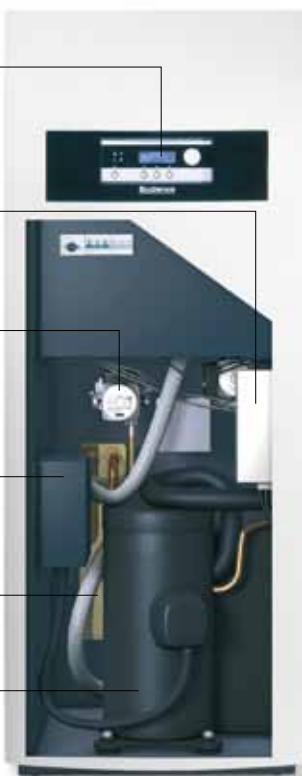
Logatherm WPS 6-17 кВт

Обеспечивает высокую продуктивность теплового насоса, но при этом работает тихо благодаря оптимизированным рабочим дискам.